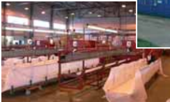
aluplast RUS, Moskau