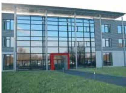
Nuevo edificio de Administración junto a la autopista A5

El 1 de enero de 2005 finalizó la construcción del nuevo edificio de Administración en Karlsruhe. Se logra así la concentración de todos los diferentes departa-