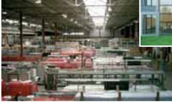
aluplast D, Karlsruhe